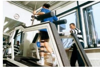
Gangschulung auf dem Laufband unter Teilbelastung