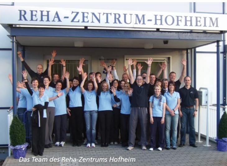
Das Team des Reha-Zentrums Hofheim