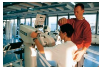
Medizinische Trainingstherapie zur Kräftigung der Schulter- und Rumpfmuskulatur