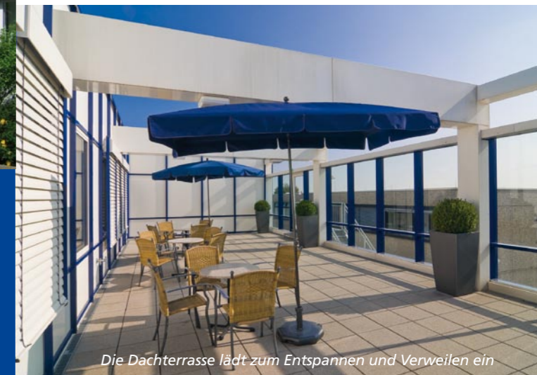
Die Dachterrasse lädt zum Entspannen und Verweilen ein

Unser Reha-Team wird Sie auf diesem Weg begleiten und die richtigen Impulse setzen.